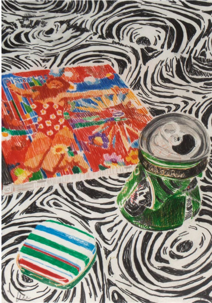
DE VIAJE (de la serie "Cómo pinté algunos cuadros míos") Javier Martín Lápiz de color/Papel. 31 x 40 cm. Adquirido