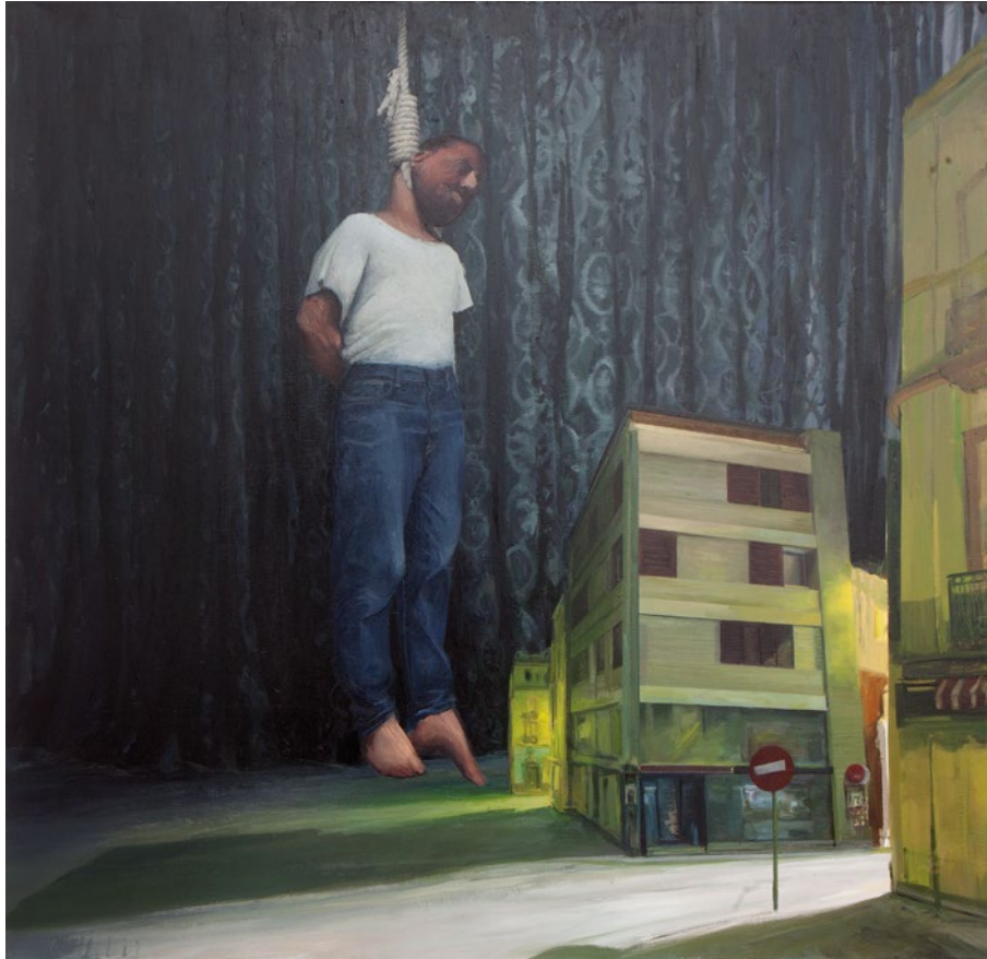
LA CIUDAD COBARDE Jabi Machado Óleo/Tela. 116 x 114 cm.