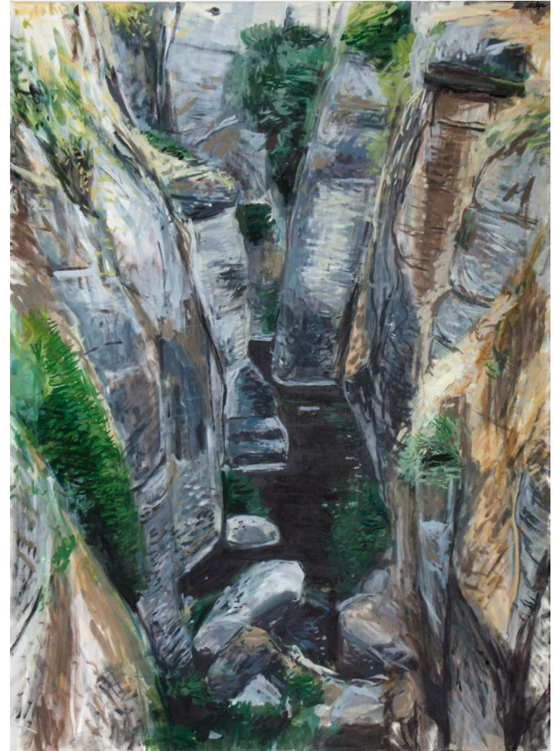
RONDA David López Panea Óleo/Tela. 115 x 150 cm. Adquirido