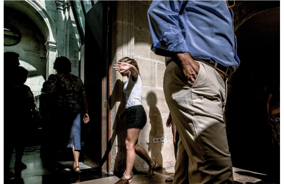
SIN TÍTULO Manuel Ibáñez Inyección tinta color/Papel algodón. 61 x 47 cm.