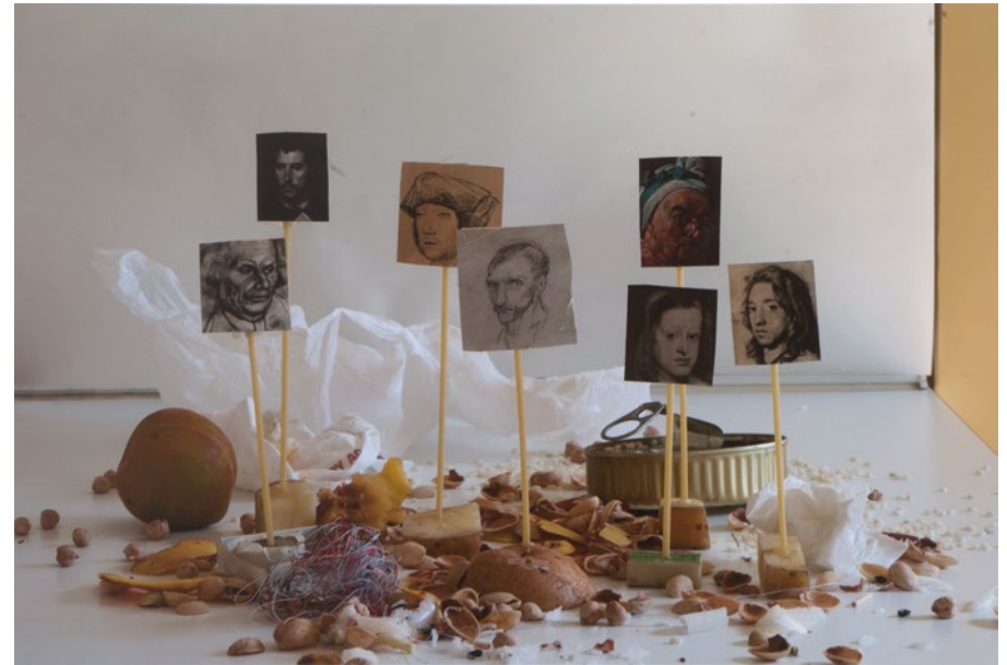
UP AROUND THE BEND Christian Lagata Fotografía analógica/Papel Hahnemühle PhotoRag. 42 (2) x 42 cm. Adquirido