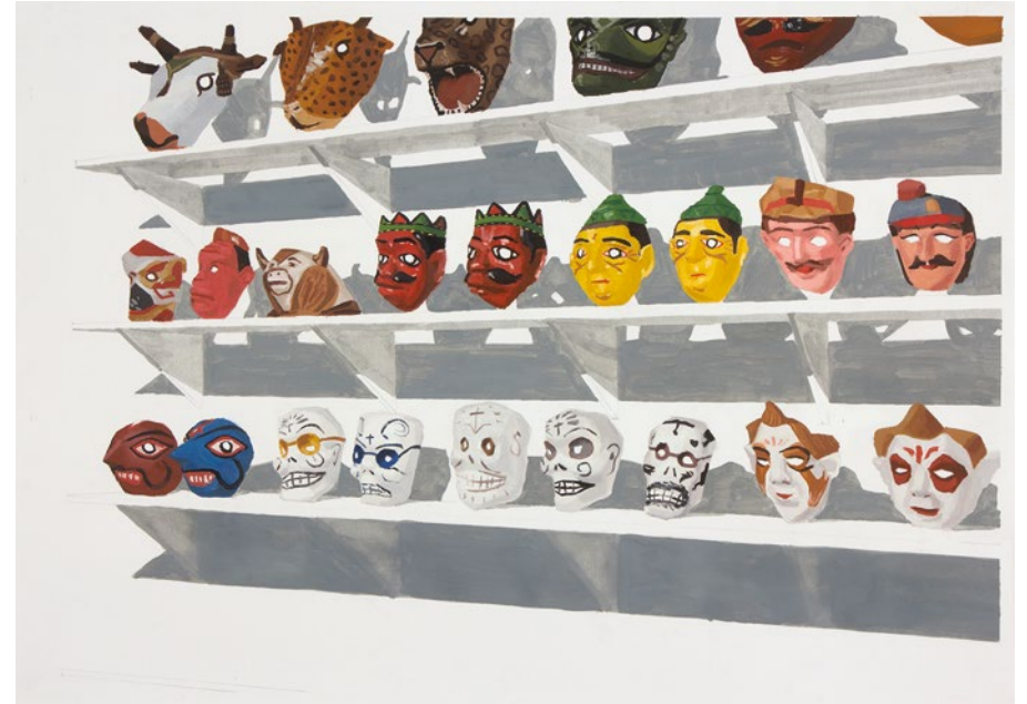
FACE TO FACE Marta Galindo Óleo/Papel. 99 x 74 cm. Adquirido