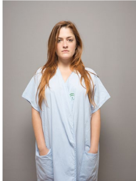
TRANSITING (de la serie: "Transiting" - 2 de 24 unid.) Mar Gascó Fotografía e impresión digital. 35 x 47 cm. c/u Adquirido