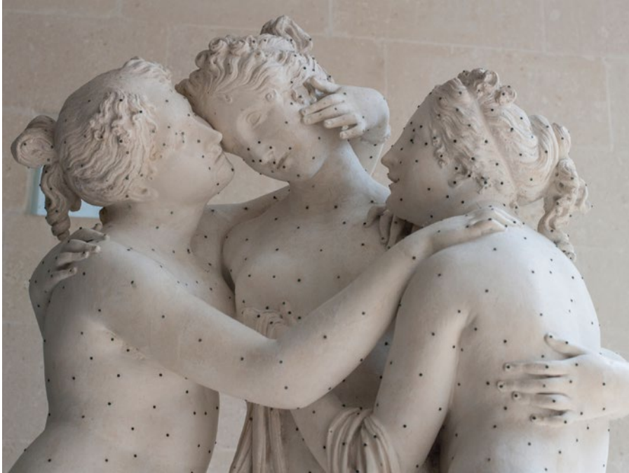
TRES GRACIAS (Gipsoteca Canoviana, Possagno, Italia, 2013) Eduardo D'Acosta Fotografía digital. 95 x 75 cm.

PASAJES DE EMILIO EN CANADÁ José Luis Anaya Álvarez Mixta/Tabla. 128 x 75,5 cm.