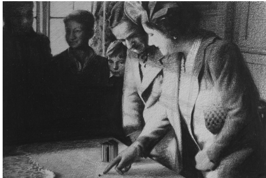
INQUISICIÓN XLVII Martínez Bellido Grafito/Papel caballo. 35 x 29 cm. Adquirido