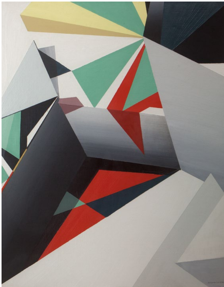
SIN TÍTULO (VEOMASGEO) Fernando Clemente Óleo/Tela. 53 x 65 cm.