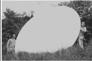
SINGULARITY Fuentesal & Arenillas Instalación, fotografía e impresión digital/Papel 250 gr. 65 x 45 cm. c/u Seriado 1/3 Adquirido